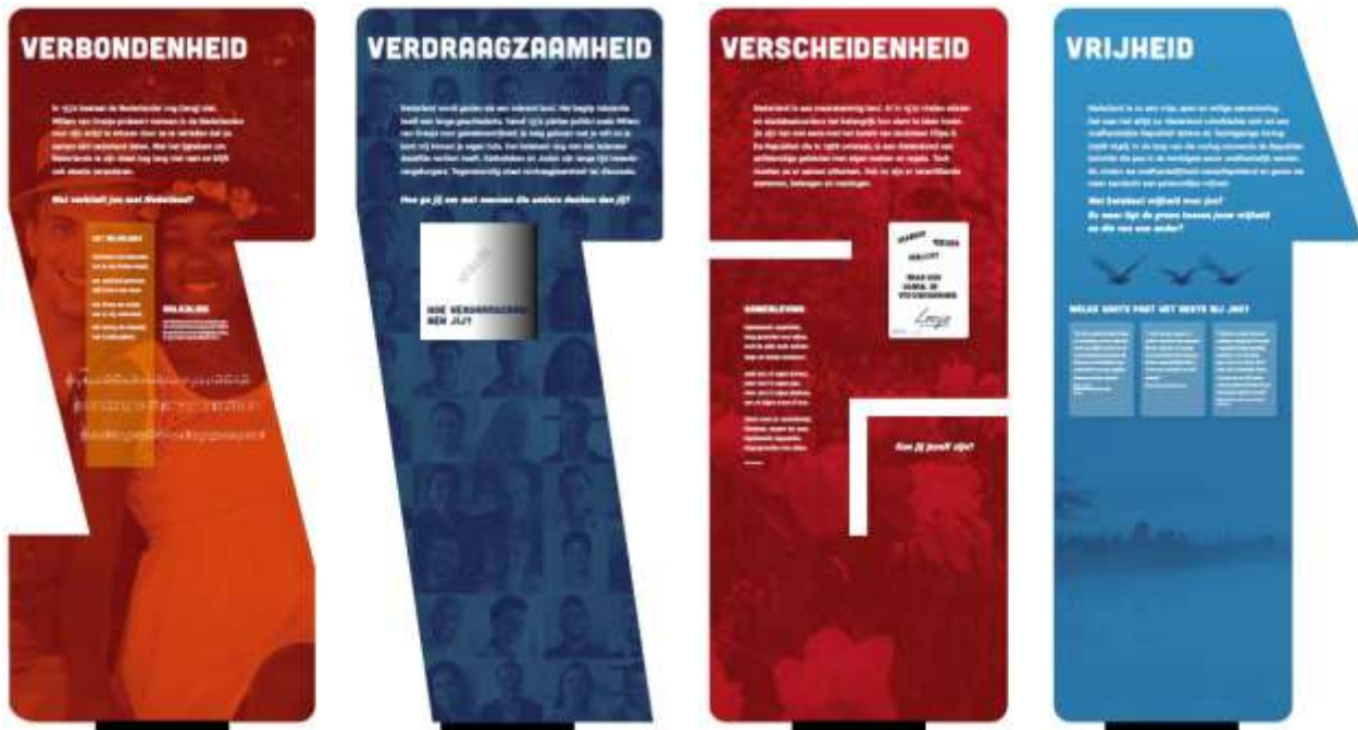
Achterzijde tentoonstelling Geboorte van Nederland

ben ik, vrij, onverveerd, den Koning van Hispanje heb ik altijd geëerd. Het Wilhelmus komt uit de zestiende eeuw. Het werd geschreven als geuzenlied, tijdens de eerste jaren van de Tachtigjarige Oorlog. In 1572 zongen opstandelingen het al.