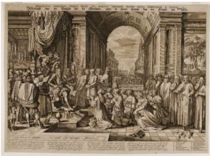
Anoniem, Tirannie van Alva - De Ellendighe Staat der Nederlanden , circa 1570, Huis Van Gijn, Dordrecht

Willem van Oranje probeert Nederlanders via propaganda te overtuigen in opstand te komen. Hij gebruikt daarvoor brieven, pamfletten en prenten. Oranje benadrukt de liefde voor het vaderland en de strijd om oude vrijheden. Godsdienst staat meer op de achtergrond. Zo probeert hij zowel katholieken als gereformeerden aan zich te binden. Dit beeld is een samenvatting van Oranje's argumenten. De hertog van Alva zit op een troon. Hij houdt de zeventien gewesten uit de Nederlanden vast aan kettingen, ze zijn verbeeld als vrouwfiguren met het wapen van hun provincie. De burgers mogen niets zeggen en staan achteraan. De vrijheden (privileges) liggen vertrapt op de voorgrond. Op de achtergrond zien we de gruweldaden van Alva.