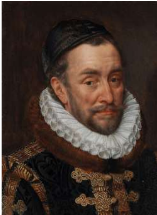
Adriaen Thomasz. Key, Portret van Willem van Oranje , 1579, Rijksmuseum Amsterdam

Koning Filips II stelt Willem van Oranje verantwoordelijk voor de 'rebellie'. Hij stuurt de hertog van Alva om orde op zaken te stellen. Oranje vlucht naar het Duitse Dillenburg. In 1568 organiseert hij een eerste militaire invasie, maar dat wordt geen succes. Op 1 april 1572 krijgt de Opstand een nieuwe impuls na de inname van Den Briel door de watergeuzen. Kort daarna kiezen belangrijke steden zoals Vlissingen en Enkhuizen de kant van Oranje.