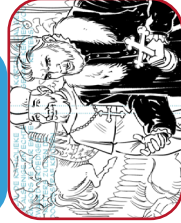
Je moet katholiek worden. Ga 2 plaatsen terug.