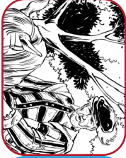
Willem van Oranje wordt de leider van de Opstand. Zing samen het eerste couplet van het Wilhelmus

Beeldenstorm. Ren 3 plaatsen vooruit voor ze je pakken.