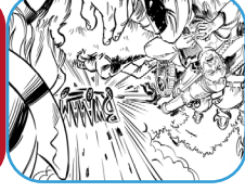
Je raakt gewond in de strijd. Hinkel een rondje rond de tafel.

1568 De 80-jarige oorlog begint met de slag bij Heiligerlee. Roep hard: Aanvaluhh!!!