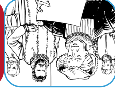
Edelen smeken Margaretha van Parma minder streng te zijn. Ga een stap vooruit.

Alva komt naar de Nederlanden. Kijk heel bang.