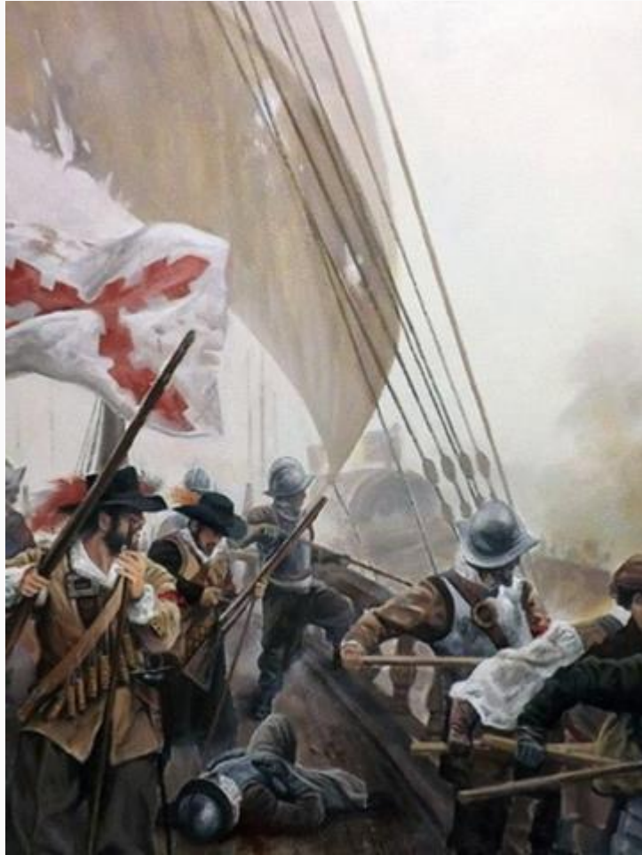
Slag om het Haarlemmermeer